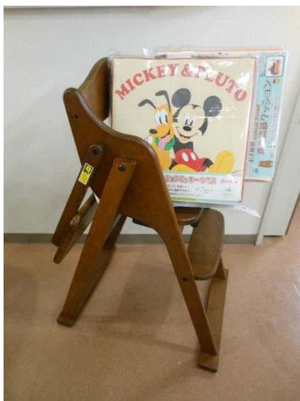
乳幼児用椅子・クッション