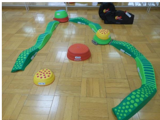
平均台・バランスストーン